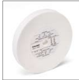
Meule ø 150 x 20 x 15 mm, grain 100 art. 700392