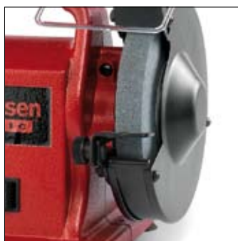
Meule ø 150 mm