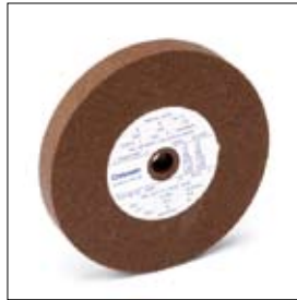
Meule ø 150 x 20 x 15 mm, grain 80 art. 700128