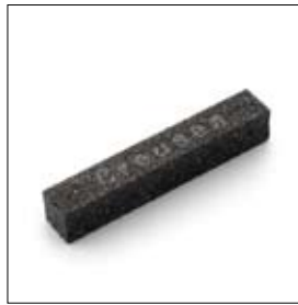
Pierre à dresser 125 x 20 x 20 mm art. 900251