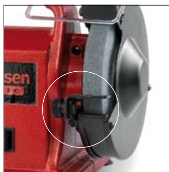
Support de travail inclinable