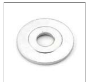
Flasque de serrage 50/15,1 x 4 mm art. 200420