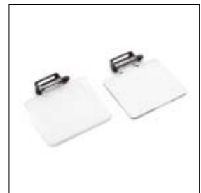
Écran universel par deux pièces art. 900009