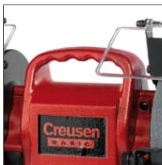
Poignée de transport