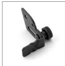
Table support gauche et droit par deux pièces art. 1330085