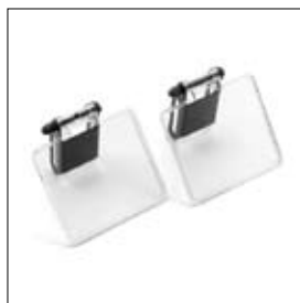
Écran universel avec pare éclat par deux pièces art. 900900