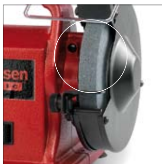
Accès facile aux meules