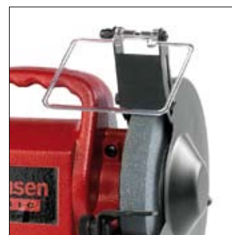
Support de travail stable écran en polycarbonate