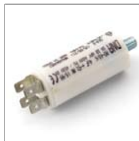
Condensateur 4uf art. 460020