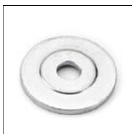
Flasque de serrage 50/12,1 x 4 mm art. 200409