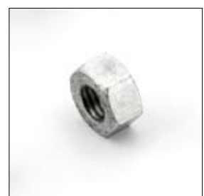
Écrou M12 droit art. 668437