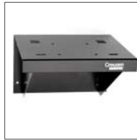
Support mural 270 x 220 x 180 mm art. 900317