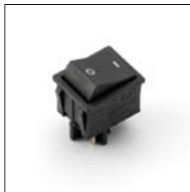
Interrupteur, 2 pôles noir art. 449010