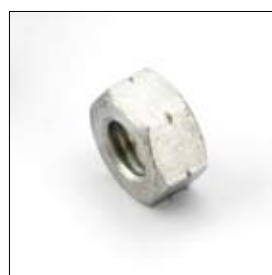
Écrou M12 gauche art. 668558